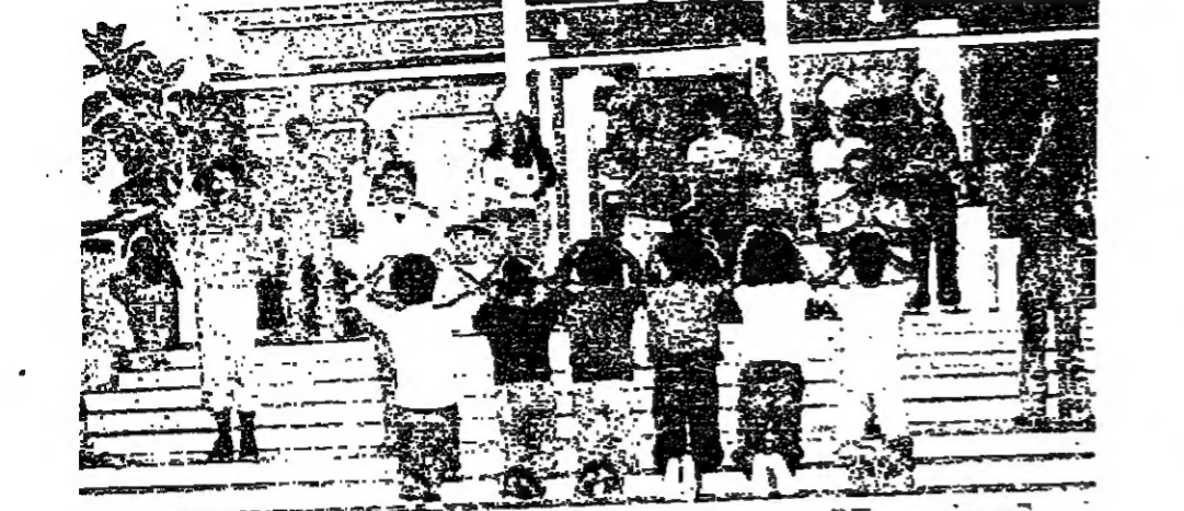
مشهد صلاة

منذ شهر جيس ، اكثر من خمسين ممثلاً وممثلاً ، انفسهم وباختيارهم ، في دير سيدة البرج ، وذلك في سبيل تحقيق عمل مسرحي جيد ، في السلوه وني نظمته . والعمل المسرحي يسمى ان ترجم حياة الطوباوي شربل مخلوف ، منذ ولادته حتى اللطحات الاخيرة من حياته مروراً بالسنوات الطويلة التي عاشها في الدير وفي محبته على قمة غايا . والعمل سوف يقدم في راس الاسبوع الثقافي الذي سيقام في روما ، في مناسبة احتفالات القديس التي يقبها الفاتيكان للطوباوي شربل مخلوف الذي سرفعه قديساً .